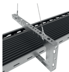
Avec Y Express embout Crochet