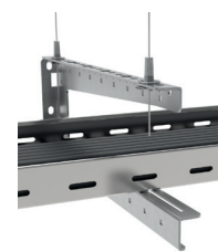
Avec le Trapèze TPZ