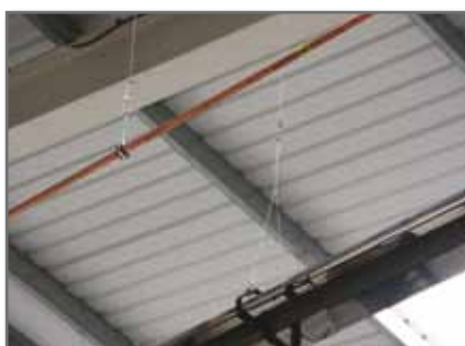
Paneles de gas