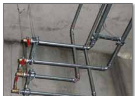
Tuberías de acero