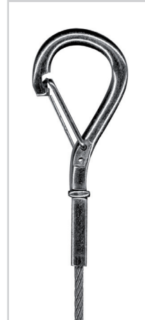
Mini Haken (ECS)