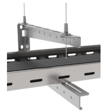
Mit Trapez TPZ