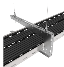
Avec le Trapèze Plus