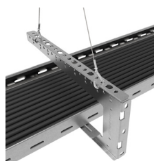
Avec Y Express embout Crochet