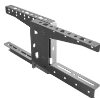
Dos à dos